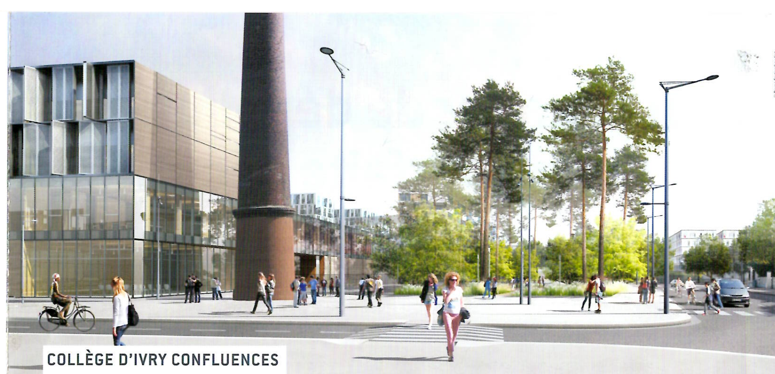
COLLÈGE D'IVRY CONFLUENCES