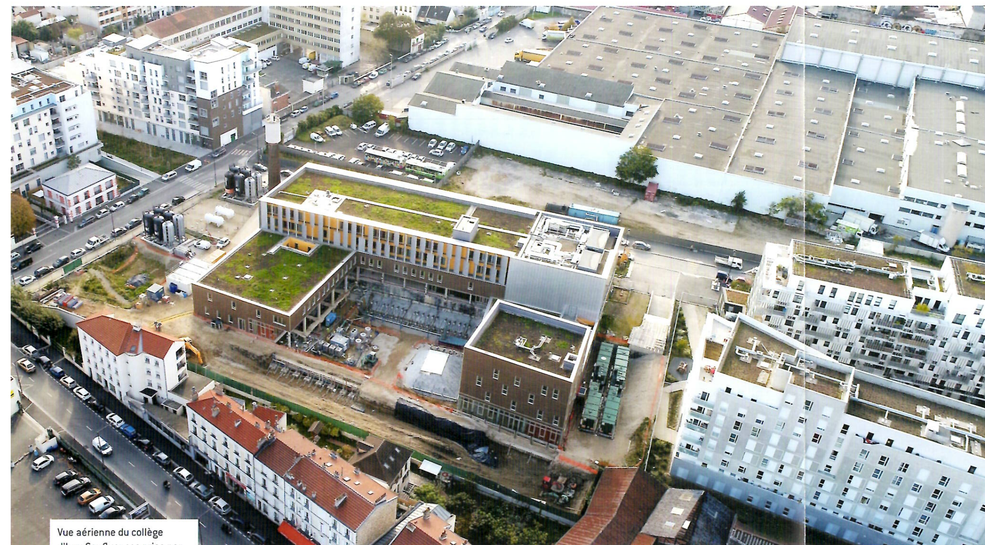
Vue aérienne du collège d'Ivry Confluences prise par drone en novembre 2017.