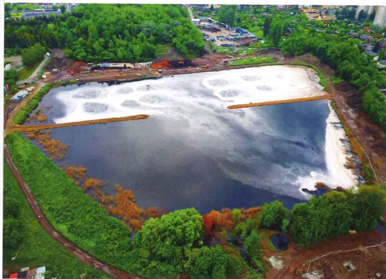
Ryc. 1. Staw Kalina w Świętochłowicach

Skażenie środowiska naturalnego na terenie województwa śląskiego stanowi poważny problem w skali całego kraju. Związane jest to z historycznymi uwarunkowaniami aglomeracji śląskiej, na obszarze której były lub są zlokalizowane liczne zakłady przemysłowe emitujące szkodliwe związki chemiczne do otoczenia. Problem skażenia terenów zdegradowanych może rozwiązać odpowiednio przeprowadzona remediacja.